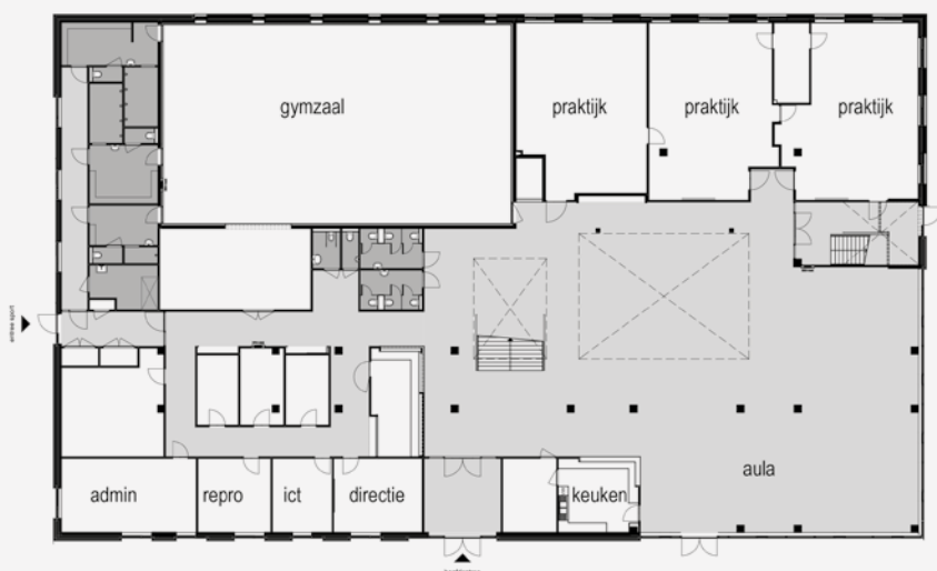
PROGRAMMA BEGANE GROND